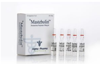
High Quality Mastebolin in USA