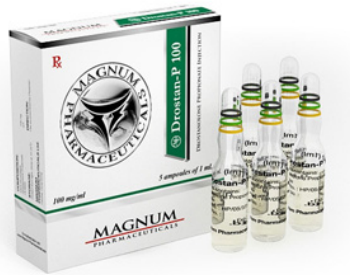
High Quality Magnum Drostan-P 100 in USA