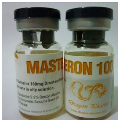
High Quality Masteron 100 in USA