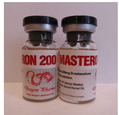
High Quality Masteron 200 in USA