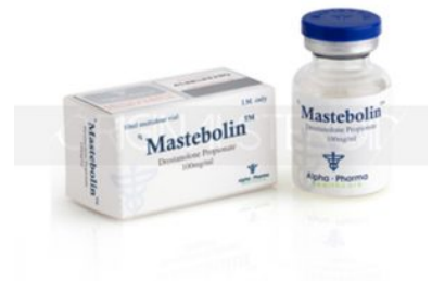
High Quality Mastebolin (vial) in USA